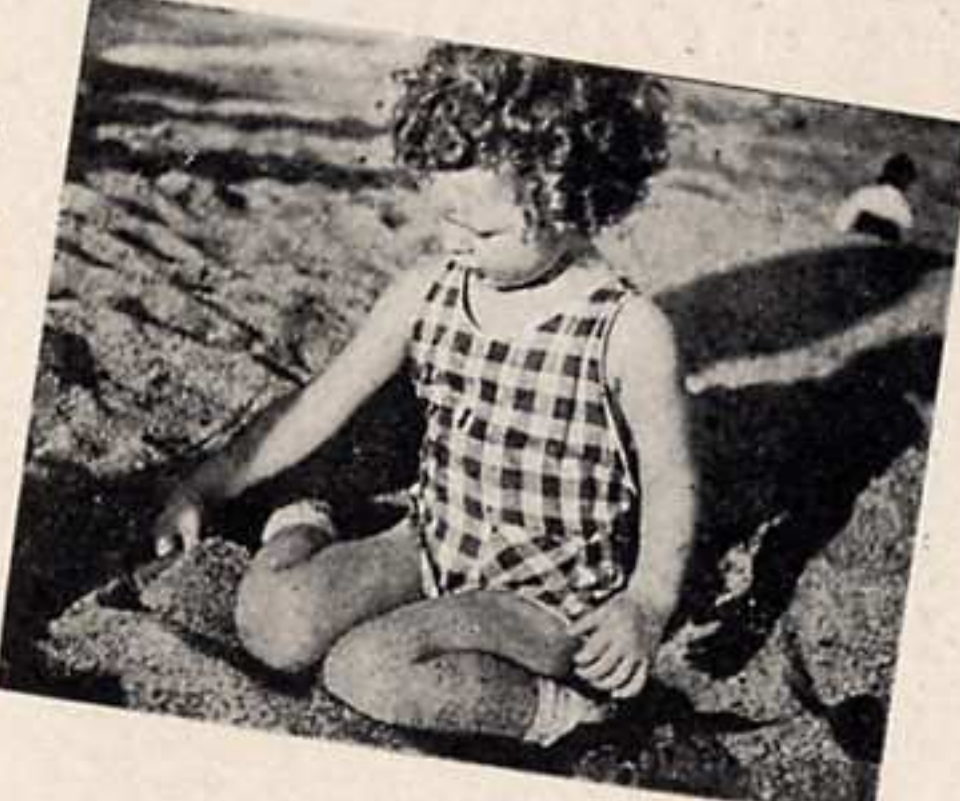
ミノルタ・ヴェスト十六枚撮