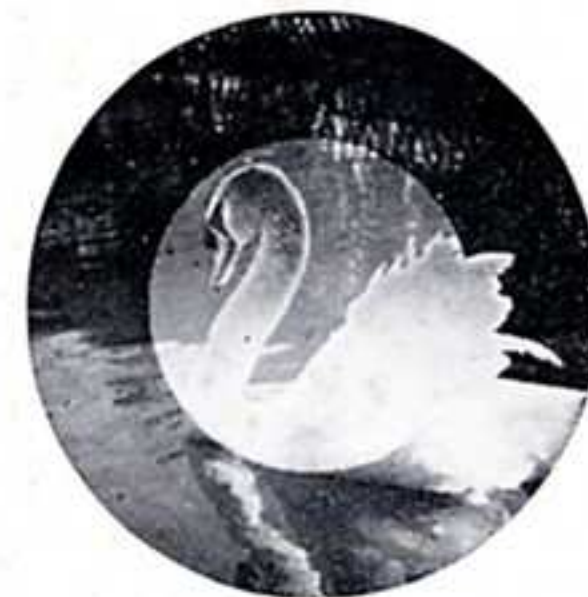
距離の合つて居る場合

近代人向の洗練された 形態美 最新機構を完備せる 性能 経済的サイズのフロン 16枚撮り