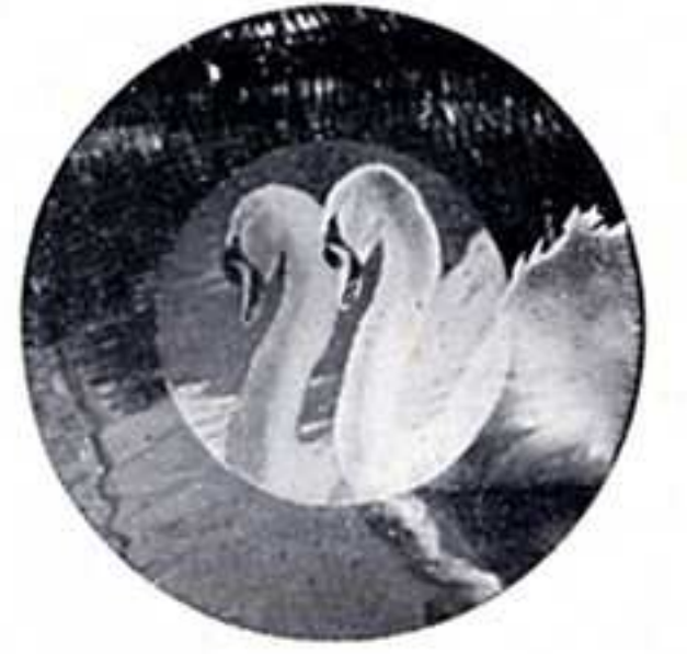
距離の合つて居ない場合